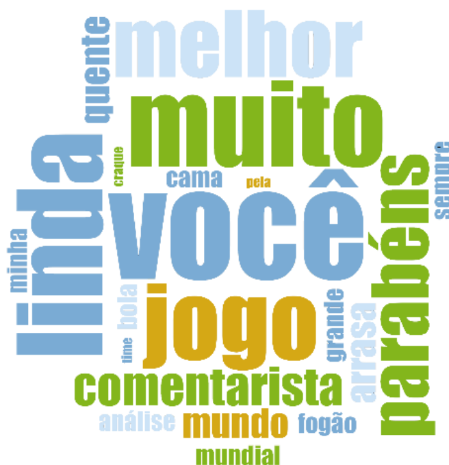
Figura 2 - Nuvem de palavras perfil pessoal